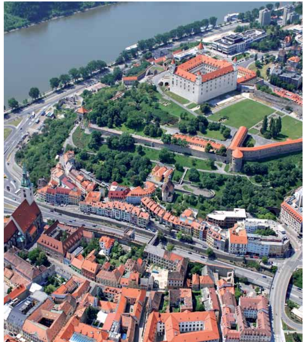
42 top zážitkov v bratislavskom regióné 42 Top Attractions in Bratislava Region

For your easier orientation, the 42 top attractions in the Bratislava region are differentiated by colour: - red - Bratislava, the capital of the SR - green - the Small Carpathians region - blue - the Danube Lowland region - yellow - Záhorie.